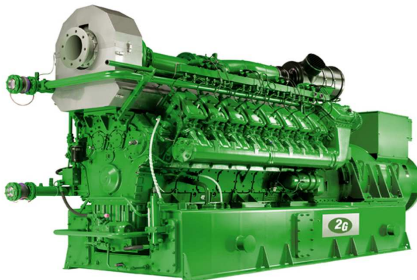
Рис.: Символическое изображение, может отличаться от описанного модуля